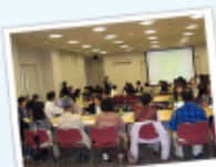
平成25年5月25日 ビッグアイ