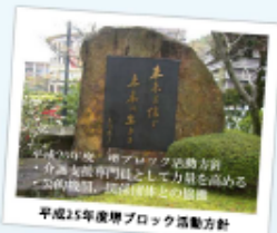
平成25年度堺ブロック活動方針